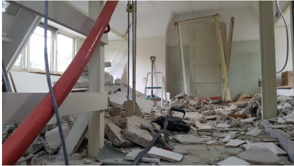
Bovenverdieping tijdens sloop