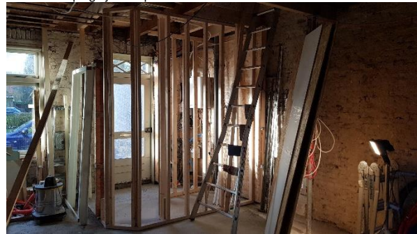
Begane grond tijdens opbouw