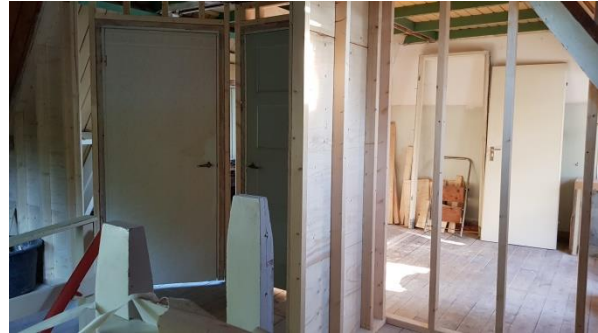
Bovenverdieping tijdens opbouw