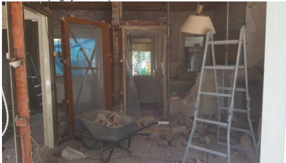
Begane grond tijdens sloop